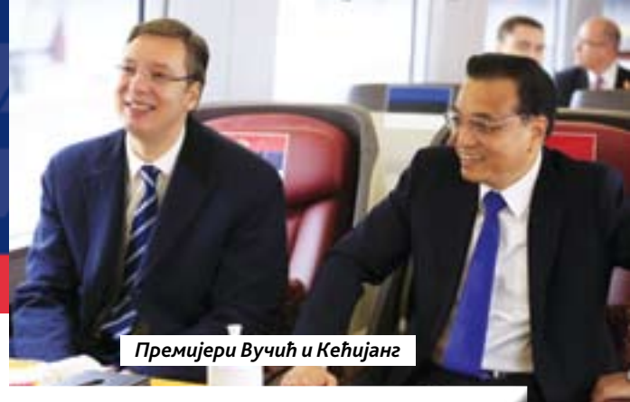
Премијери Вучић и Кеџијанг