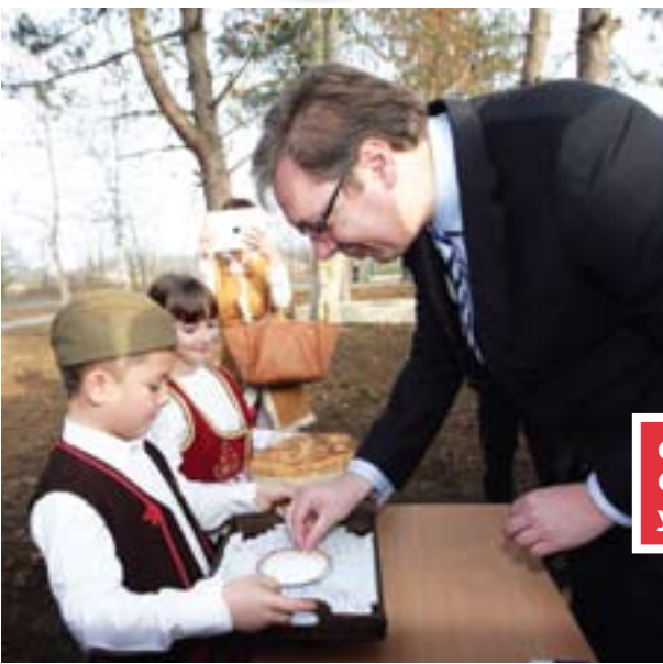
Са малишанима на отварању Основне школе „Дражевац“ у Пољанама код Обреновца