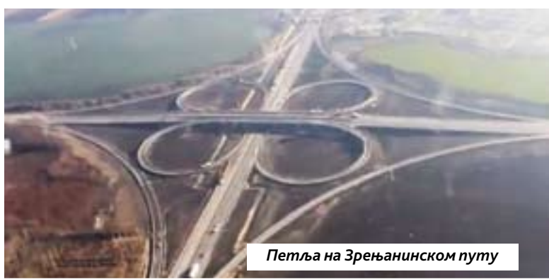
Петља на Зрењанинском путу