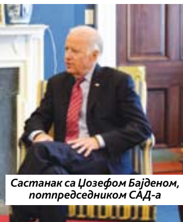
Састанак са Џозефом Бајденом, потпредседником САД-а