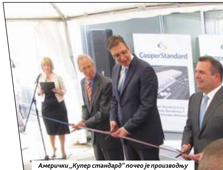
Амерички „Купер стандард“ почео је производњу у Сремској Митровици