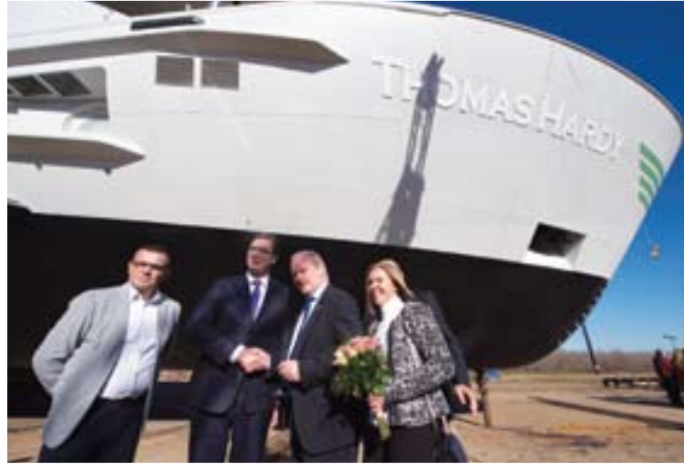
Генерални менаџер компаније „Вахали“, Винсент Бекер, и премијер Вучић на бродоградилушту у Сремској Митровици током свечаног представљања речног путничког круизера, вредног 20 милиона евра