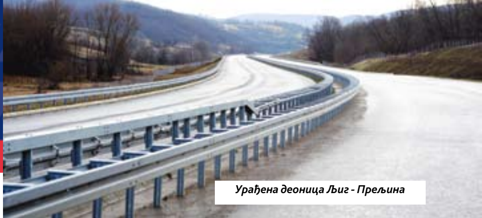
Урађена деоница Љиг - Прељина