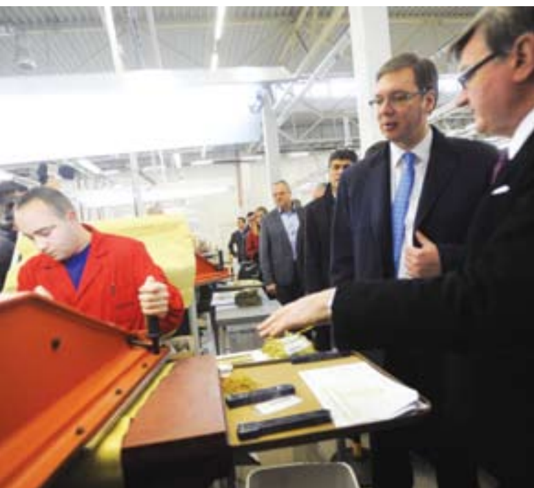
У обиласку италијанске фабрике за производњу обуће „Геокс“ која намерава да у Врању запосли 1.200 радника и годишње производи 1.250.000 пари женске модне обуће високог квалитета