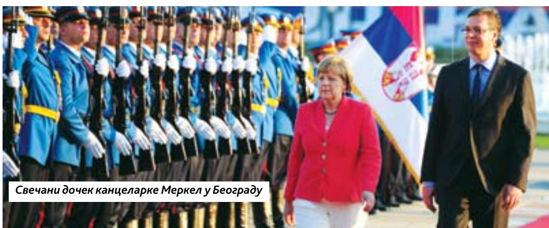
Свечани дочек канцеларке Меркел у Београду