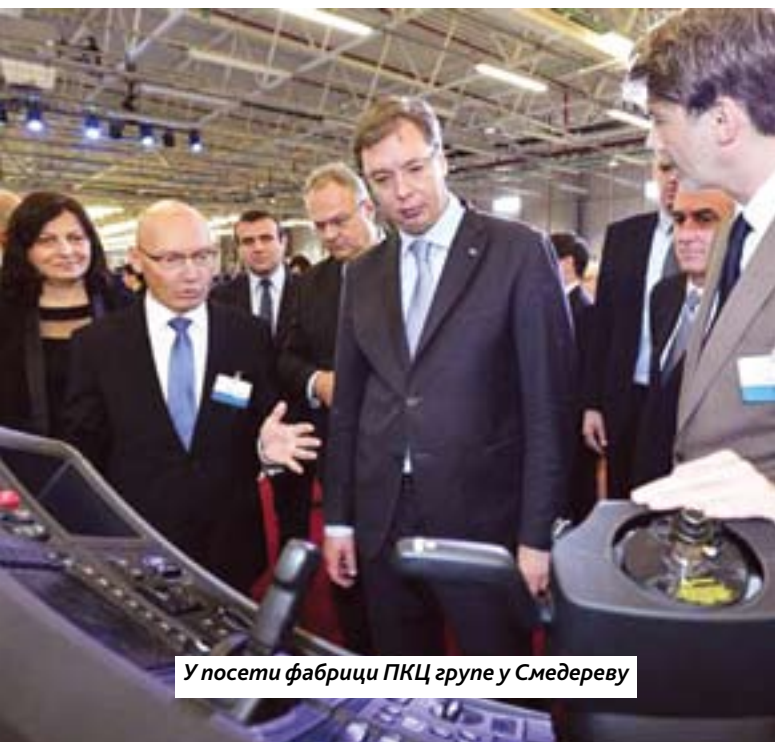
У посети фабрици ПКЦ групе у Смедереву