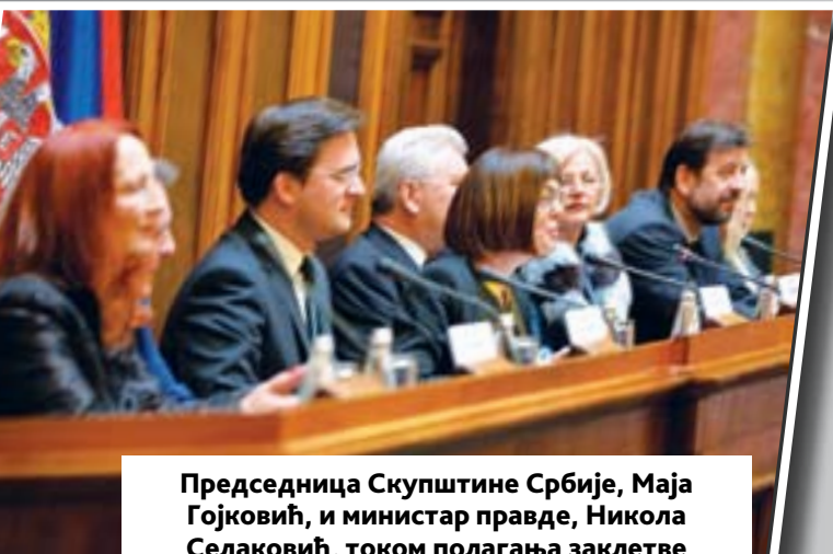
Председница Скупштине Србије, Маја Гојковић, и министар правде, Никола Селаковић, током полагања заклетве новоизабраних судија у Скупштини Србије