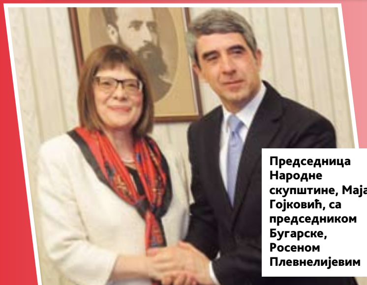
Председница Народне скупштине, Маја Гојковић, са председником Бугарске, Росеном Плевнелијевим