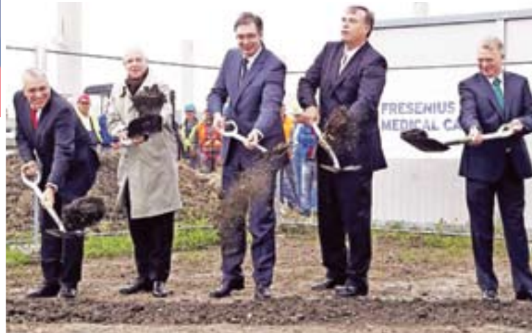
Немачки произвођач медицинских средстава „Фрезенијус медиал кер“ отворио је фабрику у Вршцу

Паралелно са унапређењем регулативе, Србија спроводи и пројекте инфраструктурног опремања пословних зона широм државе. Главне предности улагања у нашој земљи јесу повољна географска локација, бесцарински режим извоза у земље ЦЕФТА, ЕФТА и Царинску унију Русије, Белорусије и Казахстана, најнижа стопа пореза на добит у Европи (15 одсто) и образован и квалитетан кадар. Осим тога, у циљу подстицања директних инвестиција, отварања нових радних места и равномерног регионалног развоја, Србија нуди и финансијску подршку инвеститорима.